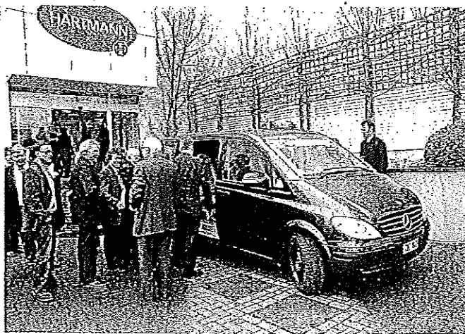
La navette, qui rellera la gare de Tubize au Parc d'activités Economiques de Saintes, est le fruit d'un partenariat entre le zoning, la Région et le Tec.